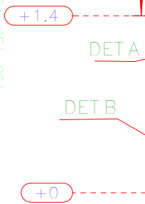
ELEVAÇÃO DO EIXO 1