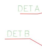
ELEVAÇÃO DO EIXO 2